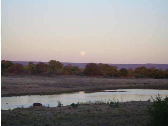
Abenddämmerung zum Fressen an Land.