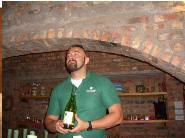
3. Weingut : MEERENDAL -- diese Weinpräsentation war nichts besonderes. Und zu guter Letzt noch auf einen Drink in ein Pub, dann ab nach Hause zu Mara.