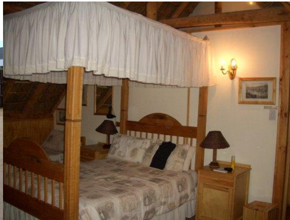
bed and breakfast

24.11.2005: (Donnerstag) Nach dem Frühstück geht die Fahrt in die KLEINE KAROO , Route 62. Traumhaft schöne Landschaft. Weiterfahrt quer durchs Land und ein kühler Drink in RONNIES SEX SHOP. Da MUSS man einfach einkehren.