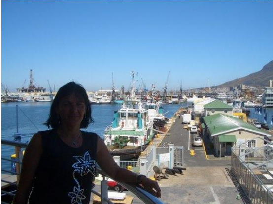
Und immer etwas los im Hafen.