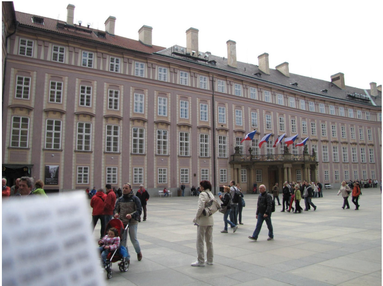
Anschließend ein Panoramafoto, welches die Größe des Palastes annähernd wiedergeben kann.