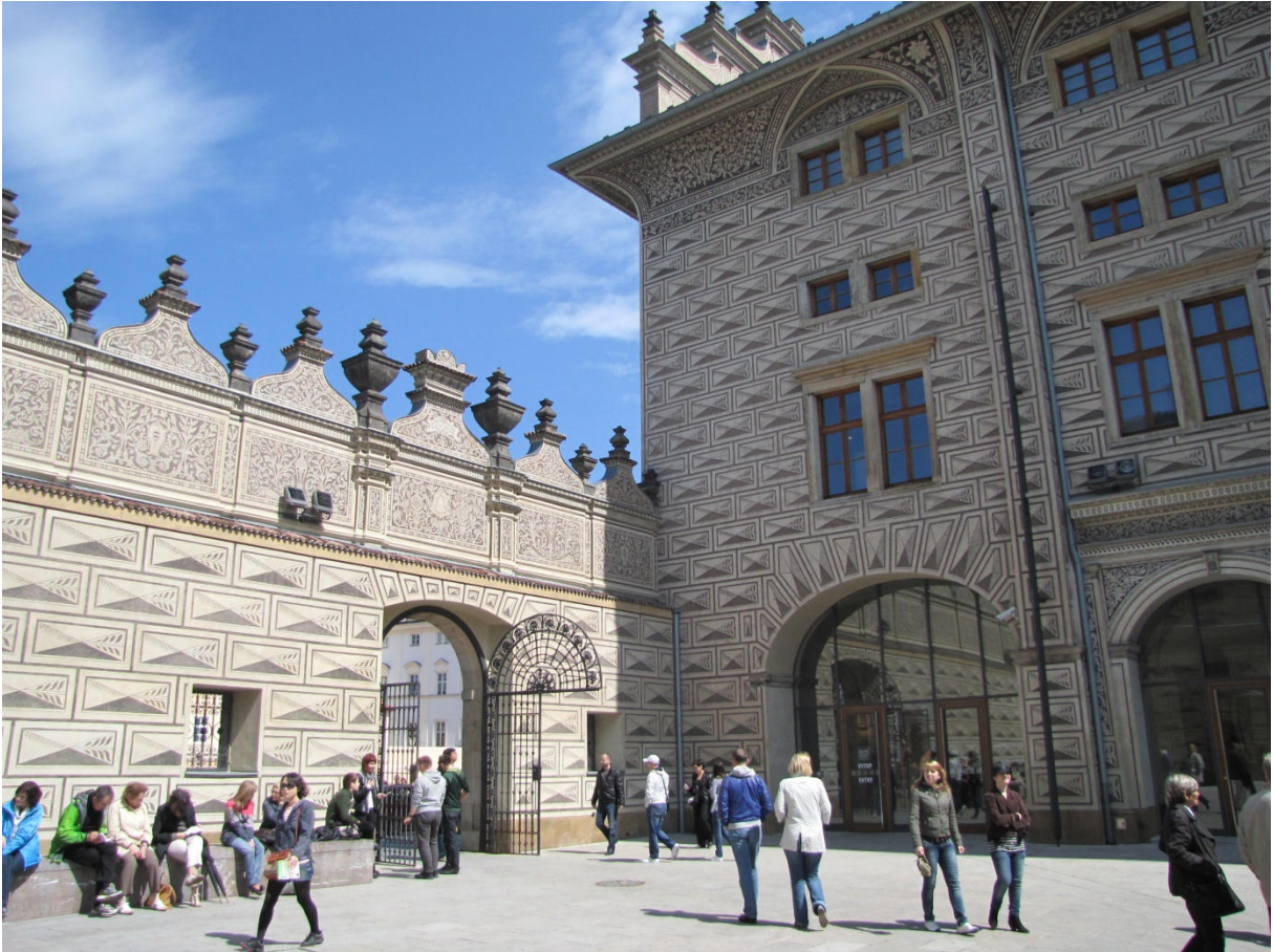
Auch andere Gebäude wo ich nicht weiß, welche es sind, sind trotzdem schön anzuschauen.