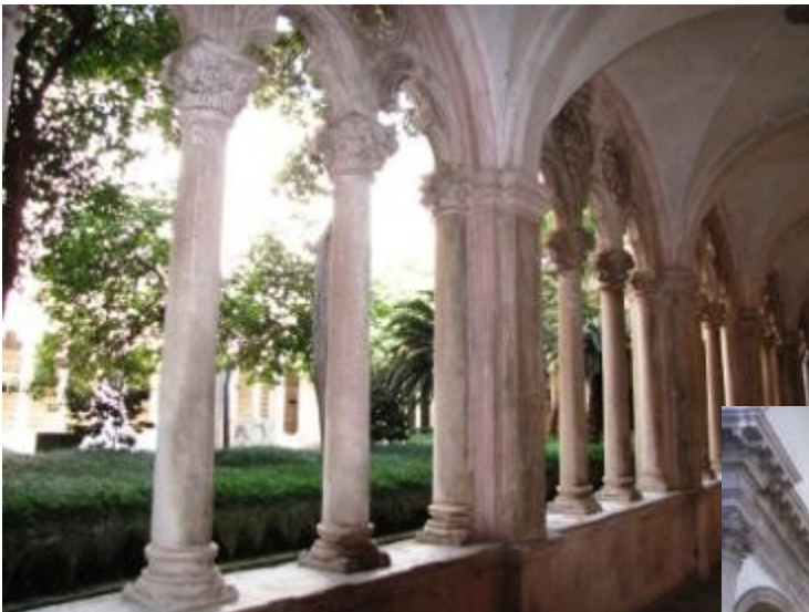
Hier noch ein Blick in den Kreuzgang des Franziskanerklosters, erbaut um 1360.