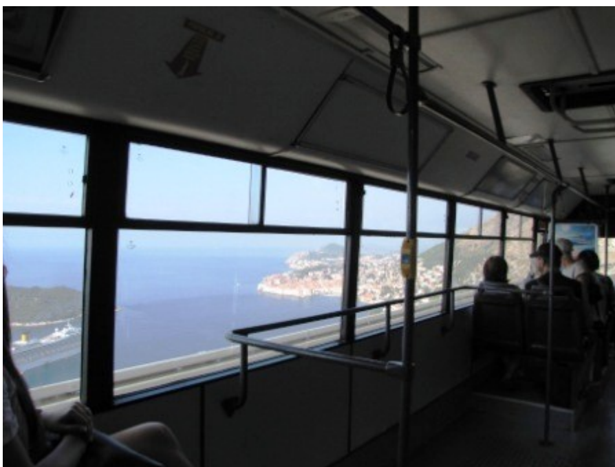
Auch ein schönes großes Kreuzfahrtschiff lag vor dem alten Hafen zwischen Festland und der Insel Lokrum

Wir hatten gut geschlafen und ich war schon recht früh auf den Beinen, während meine Edith scheinbar noch Träumen nachhing und tief und fest schlief. Um 08,00 warf ich Sie aber aus den Federn. Dubrovnik wartet und wir kommen. Da unmittelbar vor dem Campingplatz eine Busstation war, entschlossen wir uns, den Roller in der Garage zu lassen und die Fahrt in die Stadt mit dem Bus zu absolvieren. Um kurz vor halb zehn waren wir überpünktlich an der Busstation. Der Bus war aber trotzdem schon weg und so warteten wir eine halbe Stunde bei recht warmen 27° in der prallen Sonne. So wie der Bus, den wir versäumt hatten, kam auch der Nächste wieder 10 Minuten zu früh und ab ging es nach Dubrovnik. Wir waren schon sehr gespannt auf die Perle der Adria. Die Bustickets mit 12 Kuna für die 9 Kilometer waren günstig. Bereits auf der Fahrt in die Stadt hatte man von der Steilküste aus, erste Blicke auf Dubrovnik erhaschen können. Ein gewaltiger Ausblick. Wir waren schon jetzt begeistert.