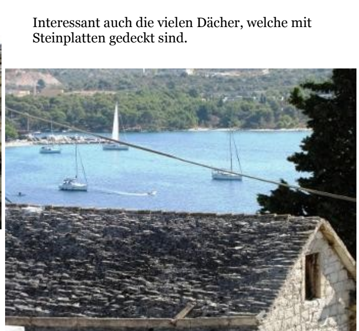
Interessant auch die vielen Dächer, welche mit Steinplatten gedeckt sind.