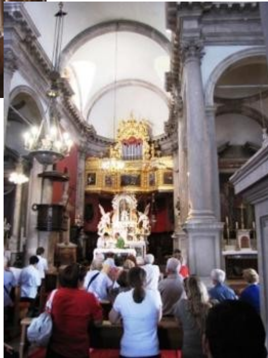
Am Ende der Placa, dem kommunalen Hauptraum von Dubrovnik, findet sich der Platz Luca. Hier steht man einerseits vor der St. Blasiuskirche, dem Glockenturm, der Stadtwache und dem Palast Sponza.