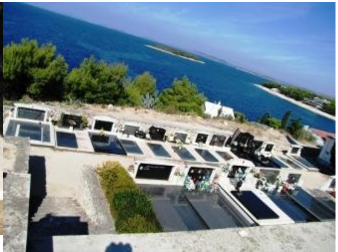
Gräber mit Meerblick, hier lässt es sich gut liegen.