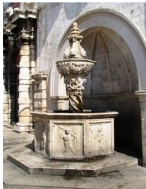
An der Stadtwache spazieren wir auch am kleinen Onofribrunnen vorbei.