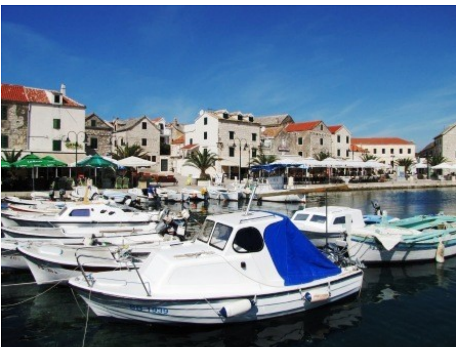
Sehr romantisch ist auch der Hafen von Primosten.