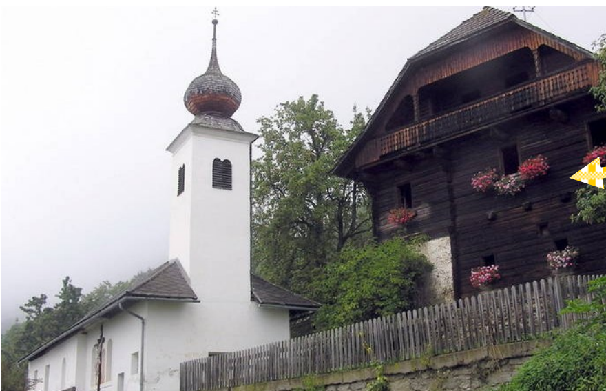
Kirchlein am Altersberg.

Vom Lieserhofen aus fahren wir die alte Römerstraße über den Ort Altersberg bis nach Trebesing .