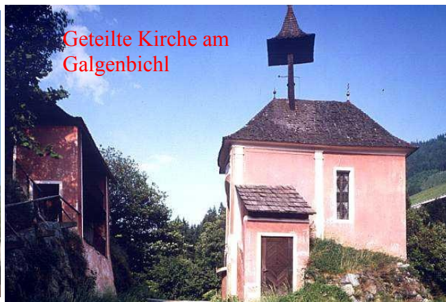
Geteilte Kirche am Galgenbichl

Blick von der alten Burg auf den Friedhof mit der Stadtmauer.