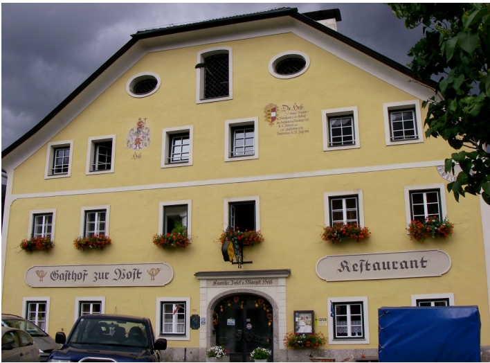
Die historische Poststation, heute Gasthof zur Post